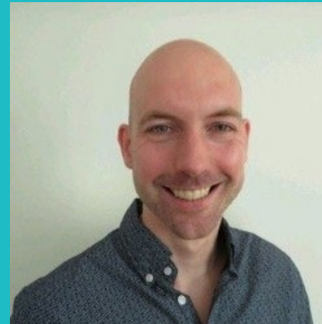
Gerard van (AC)