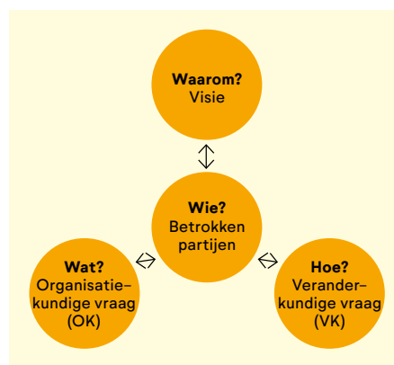
De Witte, M. & Jonker, J. (2020). De kunst van veranderen . Amsterdam: Boom

voor het Vierballenmodel van Marco de Witte en Jan Jonker (2020). Het gaat erom de vier vragen Waarom , Wat , Hoe en Wie in samenhang te beantwoorden. Het model helpt ons om bij elk van onze opgaven systematisch en reflectief te handelen. Dat wil zeggen: het waarom, de bedoeling, niet uit het oog te verliezen en gaandeweg verder te laden, en vervolgens bewust de route van verandering te kiezen. En die kan per opgave verschillen. Bij sommige opgaven weten we waarom we iets doen én wat we gaan doen, dan werken we vanuit een plan. Bij andere opgaven weten we wel waarom we iets willen, maar nog niet hoe we er moeten komen, dan werken we ontwikkelingsgericht.