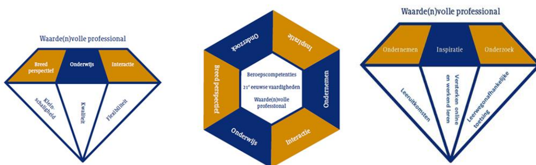
Figuur 1: Facetten Windesheim Onderwijs Concept

Ook bij het deeltijdonderwijs wordt er verbinding tot stand gebracht tussen de drie O's (Onderwijs, Onderzoek en Ondernemen). Door onderwijs, ondernemen en onderzoek te combineren zorgt een opleiding voor de inbreng van het werkveld in het curriculum. Studenten leren in het onderwijs een onderzoekende houding te ontwikkelen. Het bijbrengen of versterken van onderzoeksvaardigheden vormt een onderdeel van dit proces. Ook draagt dit bij aan de innovaties in het werkveld en de regio.