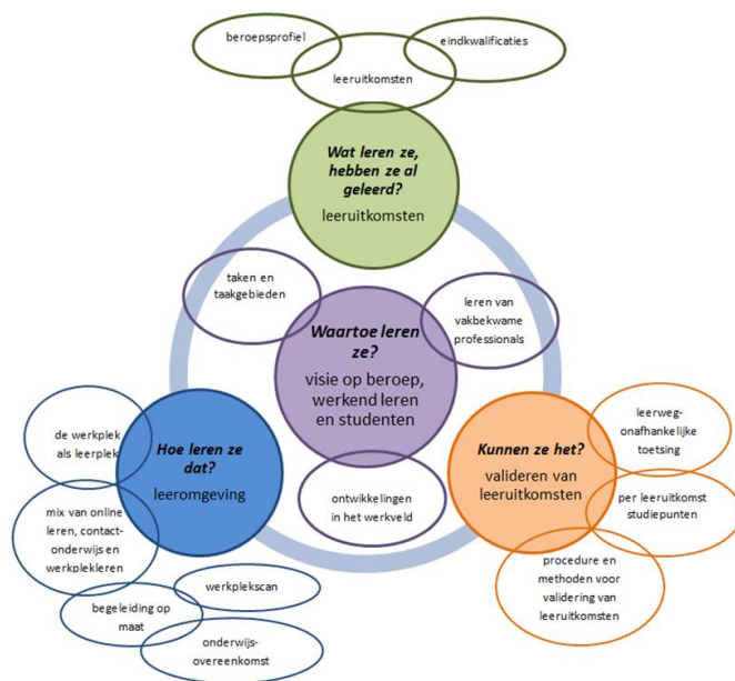
Figuur 2. Ingrediënten flexibele opleidingstrajecten

Bij het ontwerpen van flexibele opleidingstrajecten nemen we de vier vragen die in figuur 2 zijn weergegeven als uitgangspunt. Elk afzonderlijk aspect betreft een belangrijk vraagstuk dat beantwoord moet worden bij de ontwikkeling van flexibele opleidingstrajecten. De aspecten (bollen) samen vormen een consistent geheel.