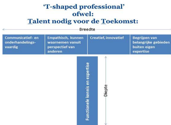
Figuur 1: Model T-shaped professional, naar Rainmaking Oasis Inc. 2014

De 21 ste eeuwse vaardigheden die de student van Windesheim ontwikkelt, sluiten hier goed bij aan. Voor een vertaling van de 21 ste eeuwse vaardigheden wordt in de opleiding het model van de T-shaped professional gebruikt. In dit T-shaped professional model richt de professional zich in de breedte op het samenwerken en communiceren met cliënten, collega's en het afstemmen op expertise buiten het eigen vakgebied. In de diepte toont de T-shaped professional zich een expert en profileert het eigen vakgebied.