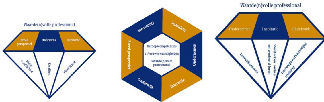
Figuur 1: Facetten Windesheim Onderwijs Concept

Voor de onderwijsomgeving van flexibel onderwijs voor volwassenen heeft Windesheim zes facetten geformuleerd: