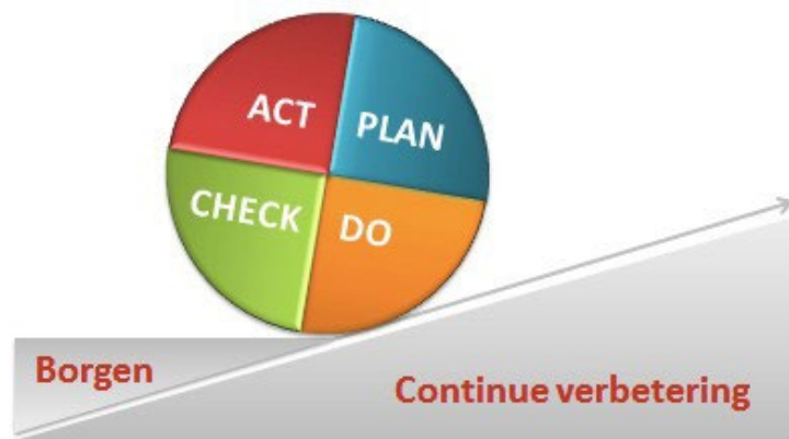
Figuur 3 Continue verbetering door borging van de PDCA-cyclus