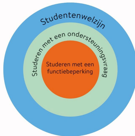
Figuur 1 Cirkels van zorg rondom de student

Opmerking. Overgenomen uit ECIO Focusgroepen door ECIO z.d. ( https://ecio.nl/wat-doen-wij/ ). Copyright z.d., ECIO